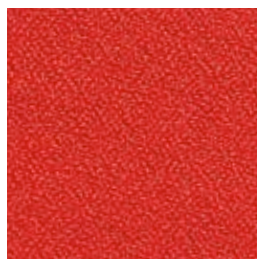
F 57 mohn