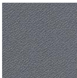
F 45 dunkelgrau