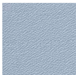
F 47 aqua