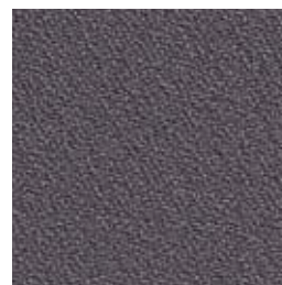
F 52 asphalt