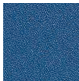
F 55 indigo