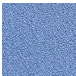
F 54 kornblume