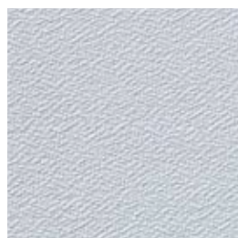
F 46 hellgrau