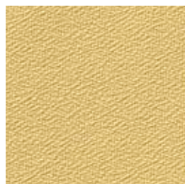
F 50 safran