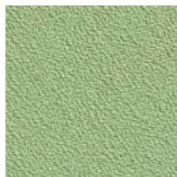
F 56 pistazie