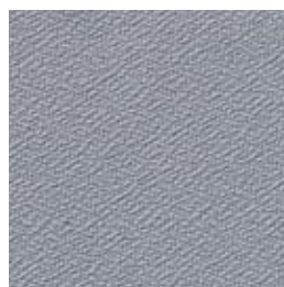
F 44 mittelgrau