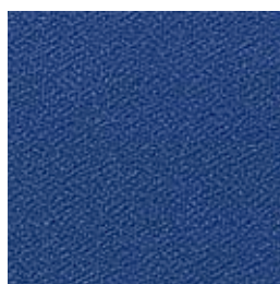
F 43 blau